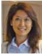
Af Maria Ewald

Jakkesæt, slips og portvinstud passer ikke på Palle og Preben, to FOA medlemmer, der netop nu bliver uddannet til forsikringstillidsmænd hos Tjenestemændenes Forsikring, men de går i uniform.