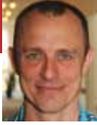
Af Anders Schou

Dette blad, "Nyt fra FOA Århus", skal have nyt navn. FOA Århus opfordrer medlemmerne til at indsende forslag og vil belønne det bedste med tre flasker rødvin eller en stor æske chokolade.