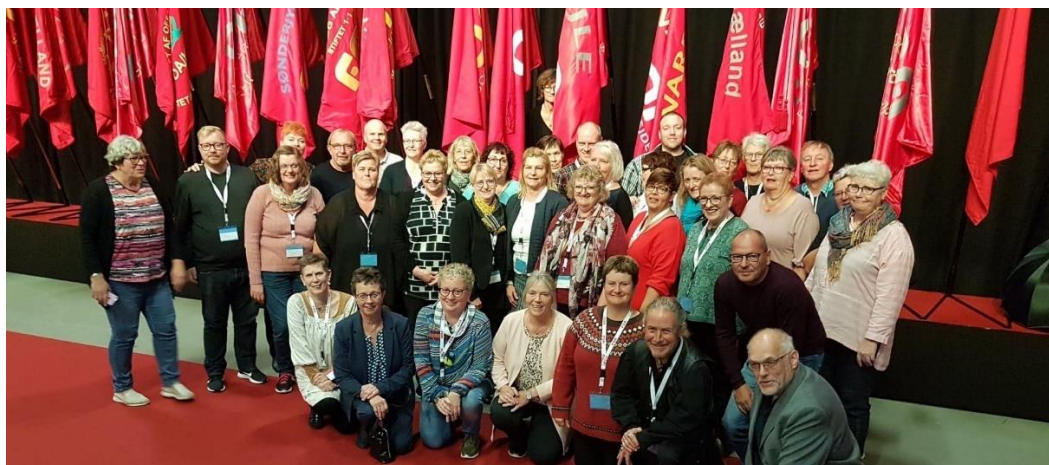
Delegerede november 2019