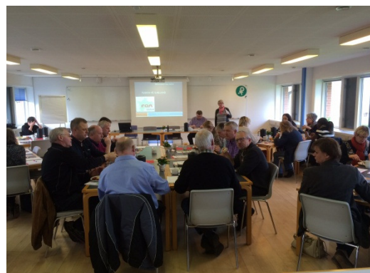
Der summer ved bordene i Salen i Holbæk Afdeling.