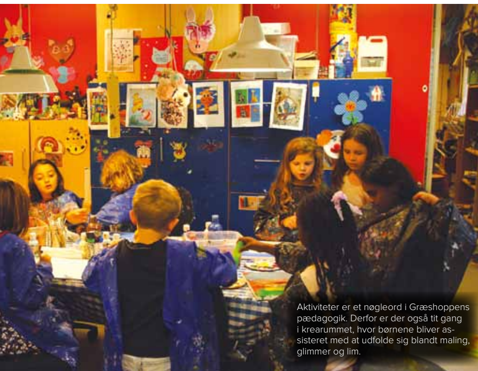
Aktiviteter er et nøgleord i Græshoppens pædagogik. Derfor er der også tit gang i krearummet, hvor børnene bliver assisteret med at udfolde sig blandt maling, glimmer og lim.