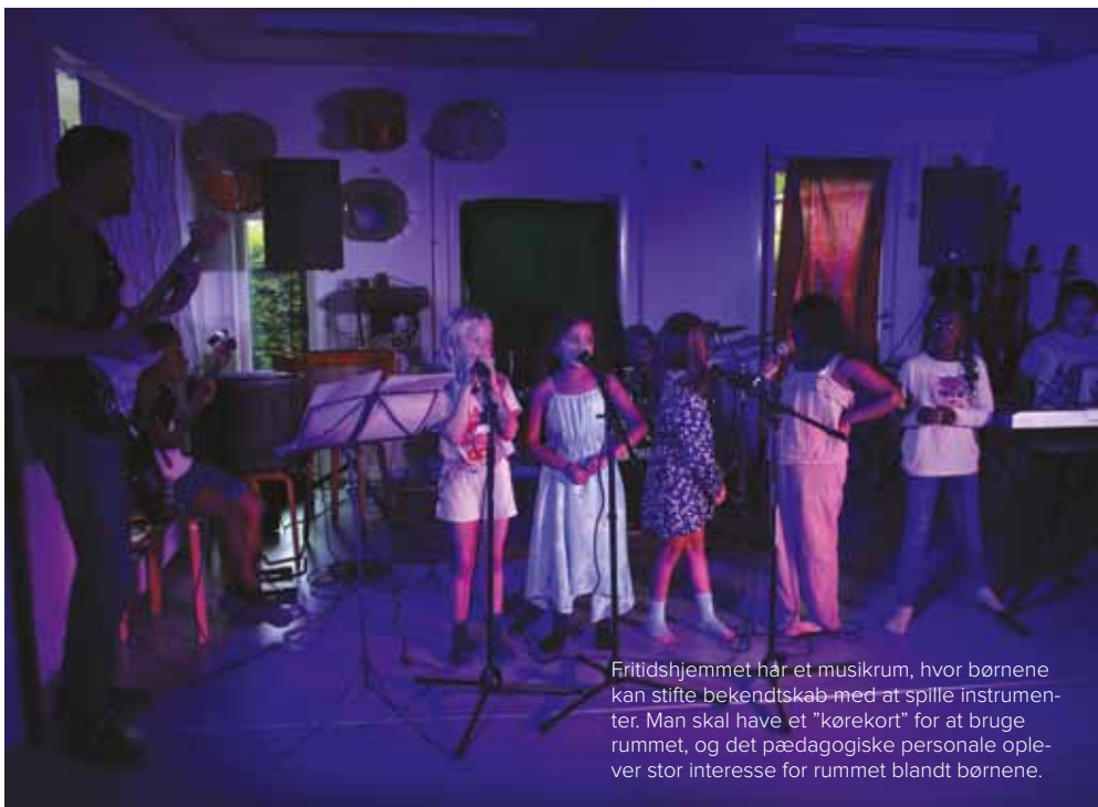
Fritidshjemmet har et musikrum, hvor børnene kan stifte bekendtskab med at spille instrumenter. Man skal have et ”kørekort” for at bruge rummet, og det pædagogiske personale oplever stor interesse for rummet blandt børnene.