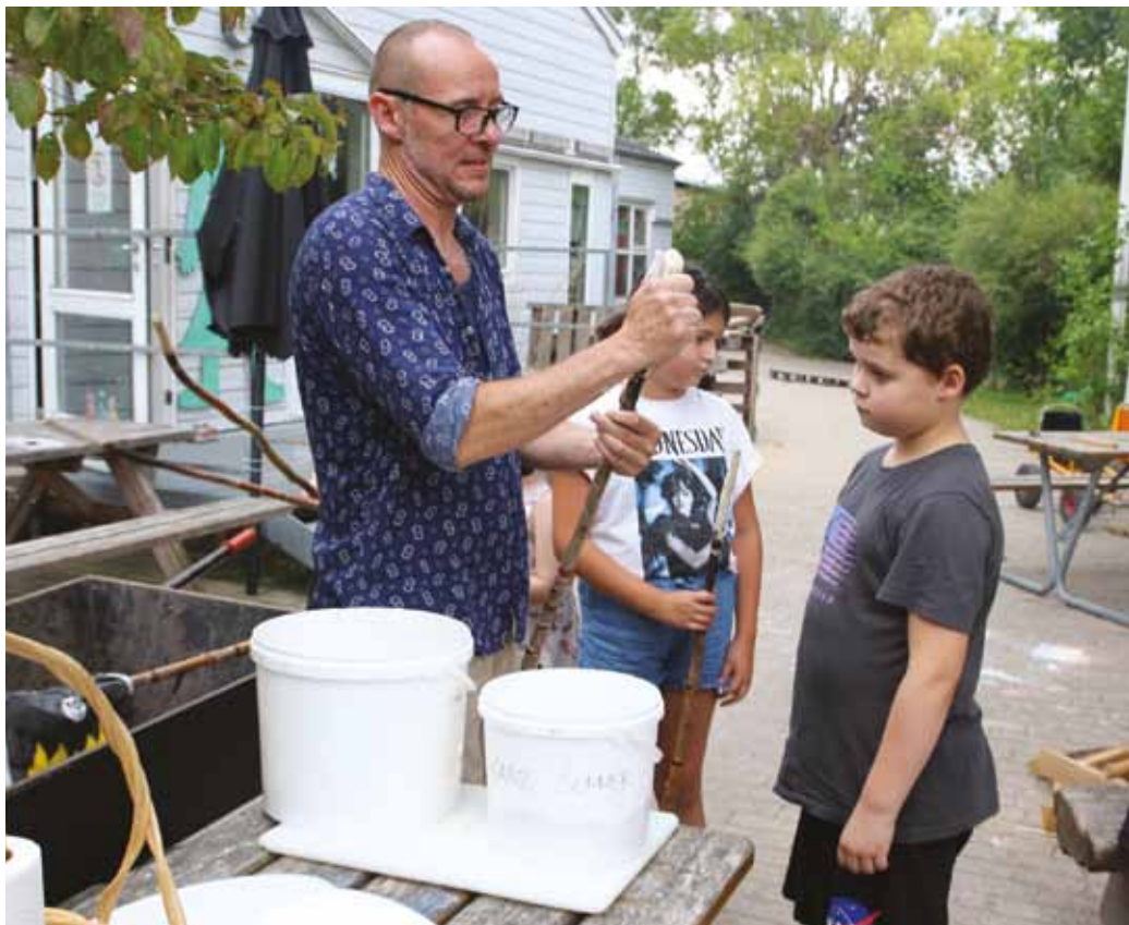
Fritidshjemmet har en bålplads, og herfra bliver der lavet eftermiddagsmad. Denne dag var det snobrød, der var på menuen.

”Vi er i langt højere grad i skolen, end vi var førhen, og der er blevet taget flere og flere timer fra os.