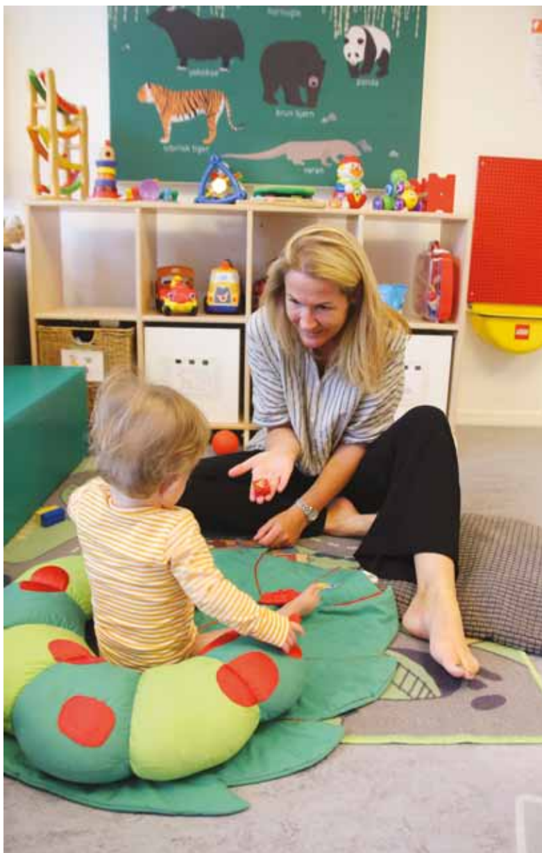
Aldersspændet på Pandastuen dækker både vuggestue- og børnehavealder, men medarbejderne lægger vægt på at lave aktiviteter, som alle børn kan deltage i ud fra der, hvor de er.

”Vores opgave er at støtte børn og familie så godt som muligt. Vi fungerer som pitstop mellem hospital og dagtilbud, og heldigvis lander 99 procent af vores børn i et alment tilbud efter en kortere eller længere tid hos os,” fortæller hun.