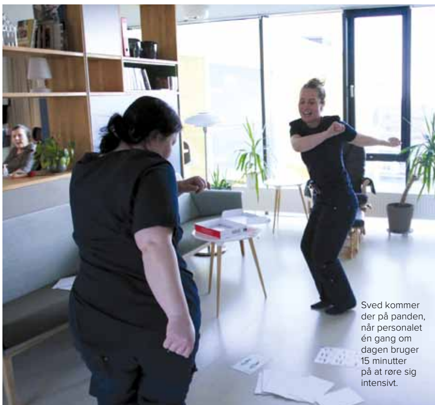
Sved kommer der på panden, når personalet én gang om dagen bruger 15 minutter på at røre sig intensivt.