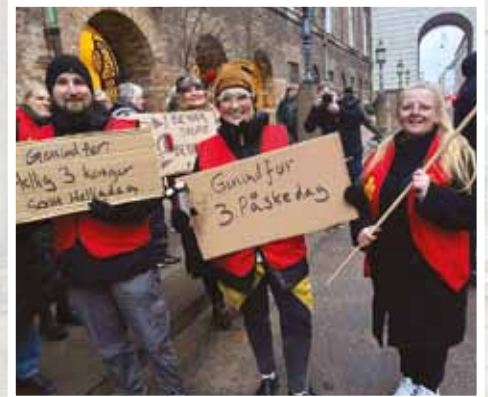
19. januar. Morgenaktion i anledning af redegørelsesdebat i Folketinget, hvor ni af spørgsmålene handlede om SVM regeringens afskaffelse af store bededag.

LFS var talrigt repræsenteret på slotspladsen og har desuden markeret sig ved de morgenaktioner foran Folketingets hovedtrappe, der har skullet minde politikerne om den massive befolkningsmodstand.