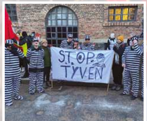
2. februar. Morgenaktion i anledning af første behandling af lovforslaget om afskaffelse af store bededag.