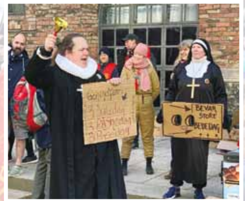
24. januar. Mette Frederiksen fremlagde lovforslaget om afskaffelse af store bededag i Folketinget.