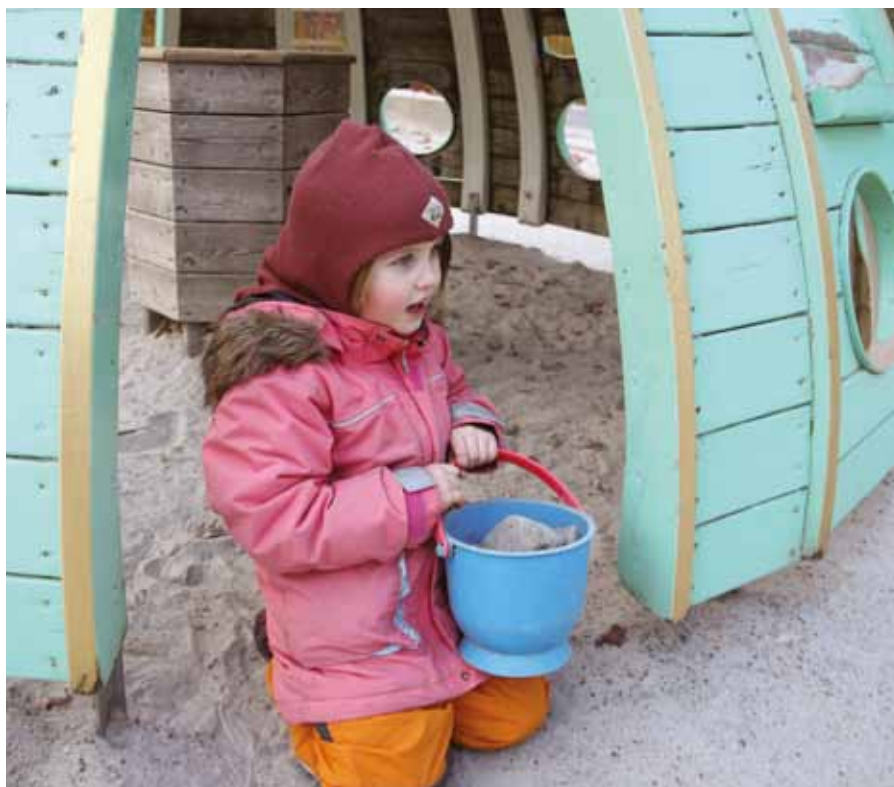
Børnene har efter materiale-safarien rig mulighed for at udforske de mange forskellige materialer på legepladsen.

Tag børnene med rundt i børnehavens rum. Snak om, hvor der er rart at være, og hvor der ikke er rart at være. Ved hjælp af flag kan børnene afgrænse et rum for på den måde at sætte ord på, at det ikke kun er larvestuen, der er et rum, men at sandkassen også er et rum.