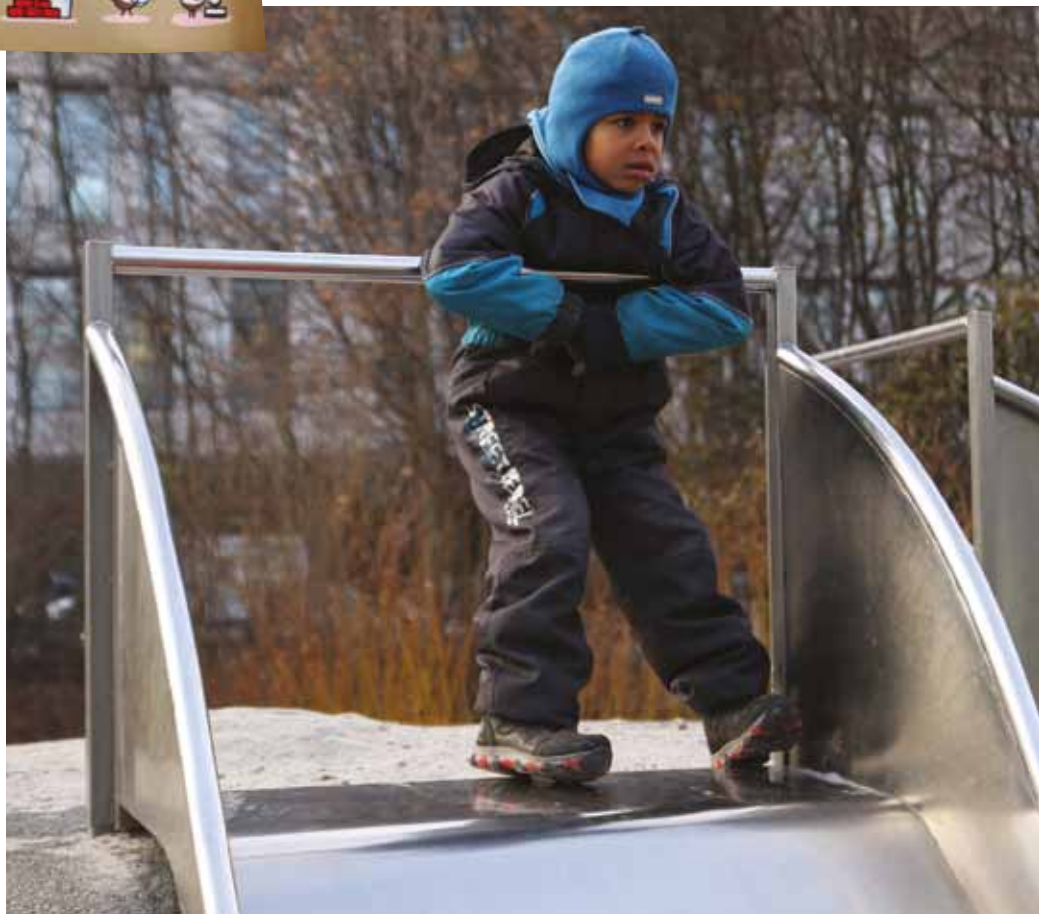
Rutsjebanen er et godt eksempel på en del af legepladsen, som er lavet i metal. Her suser en dreng fra børnehavestuen Sælterne hen til legeredskabet, som en del af materiale-safarierne på Tårnlegepladsen.

”Når jeg taler med pædagoger om arkitektur, så plejer jeg at spørge dem om, hvor det ikke fungerer, og så vælter der er en skov op med hænder, for de