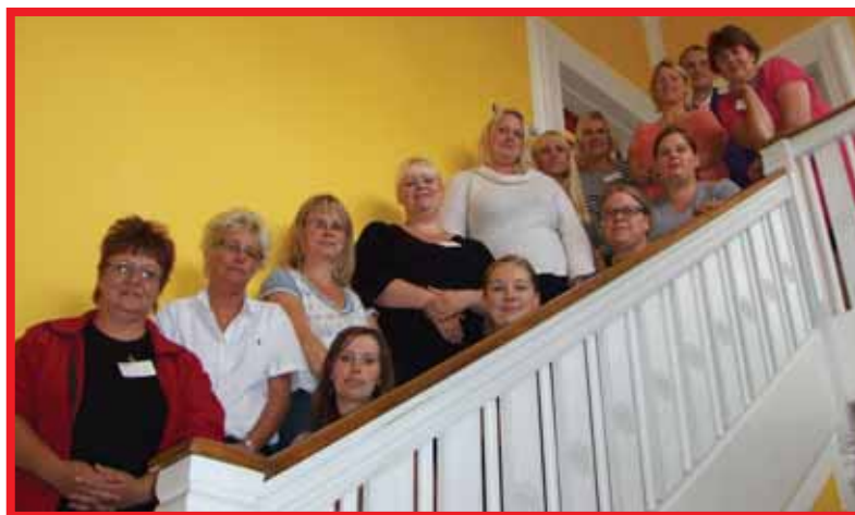
Nyvalgte TR, AMR og SUPPL. på introdag i FOA