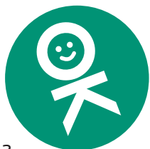
20 Styr på overenskomsten?