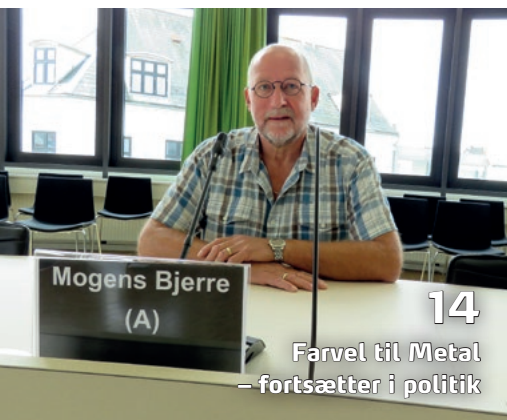
14 Farvel til Metal – fortsætter i politik