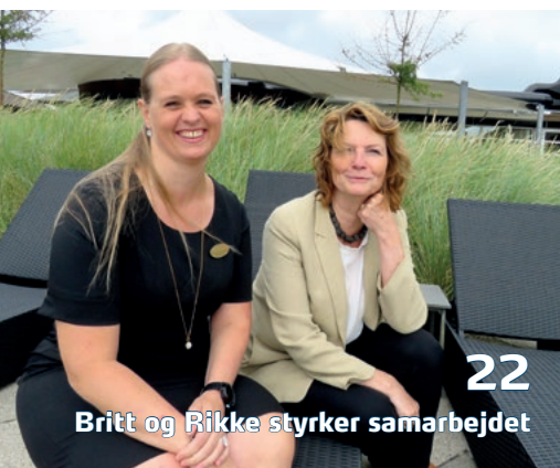
22 Britt og Rikke styrker samarbejdet