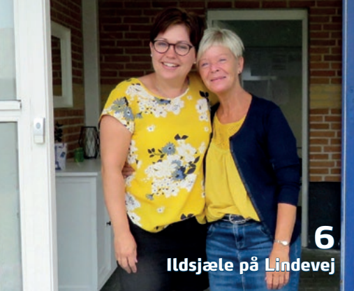
6 Ildsjæle på Lindevej