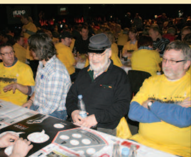
Debat ved bordene hos 3Ferne