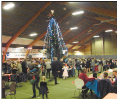
Metals juletræsfest blev i år holdt sammen med HK.

sentanter og valgt ny HB repræsentant. Der var debat, en masse gæstetalere og fremlægning af hver enkel regions aktiviteter. Søndag den 7. november afsluttede årsmødet, og vi spiste frokost og drog ud mod Kastrup lufthavn. Alt i alt et rigtig godt møde.