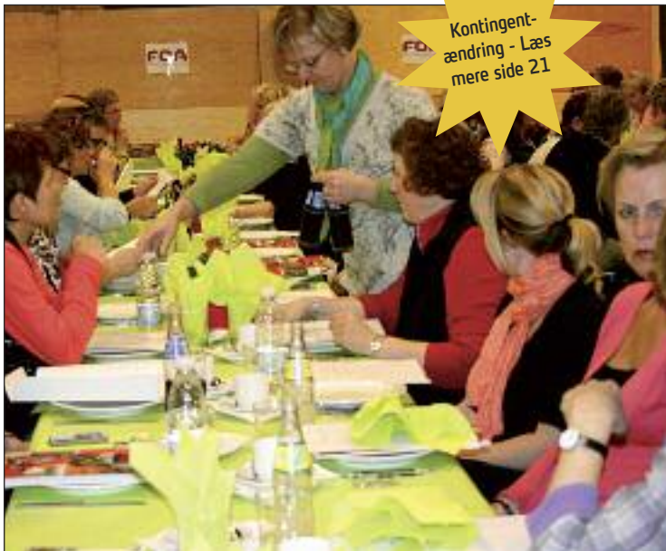
Flot pyntede forårsborde gav ekstra stemning på FOAs generalforsamling.

Under hele konflikten fik vi en positiv omtale i pressen, ligesom vi oplevede, at borgerne også var meget positive overfor vores strej-