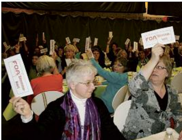
Det var et enstemmigt ja til beretning i FOA Frederikshavn.

Generalforsamlingen behandlede en række vedtægtsændringer.