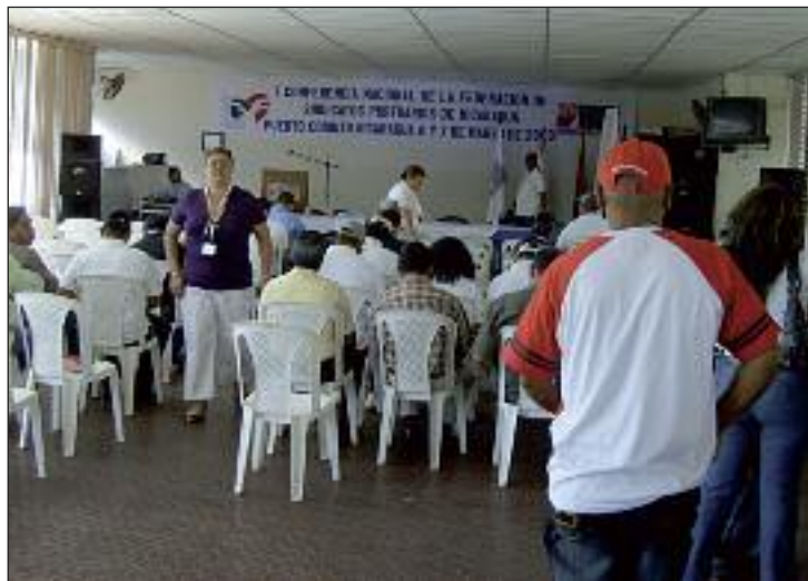
Havnearbejdere fra Nicaragua, Honduras og El Salvador til konference i Nicaragua.

Vi sendte pengene til Caja Bruhn, og så skulle de skulle så overdra-