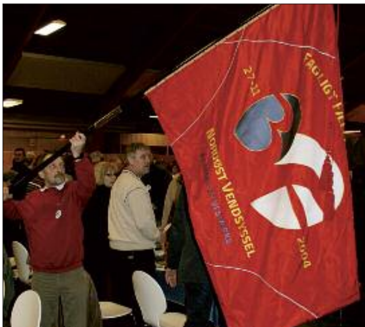
Fanen blev ført ind.