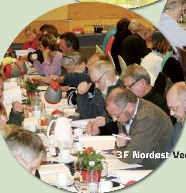
3F Nordøst Vendsyssel