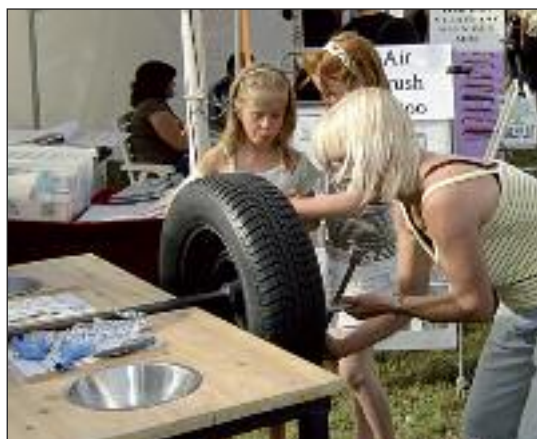
Kvinder kan også skifte hjul