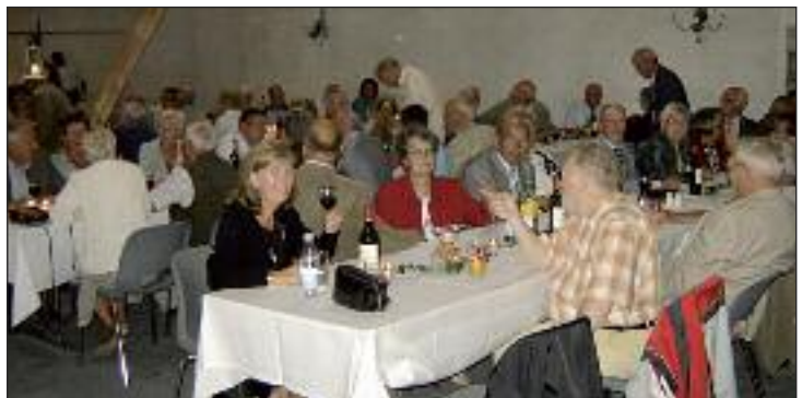
Fin stemning hos Metal-seniorene.

godt besøgt. Efter middagen bød musikken op til dans. Sidst på aftenen kørte en bus i pendulfart mellem Knivholt og busterminalen, så alle kunne blive transporteret hjem.