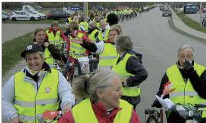
Strejkende FOA-medlemmer blev kendt i gaderne.

Demonstrationsoptog i Skagen kl. 15.30. Afgang fra Ankermedet Ældrecenter. Turen går gennem byen og til Skagen Rådhus, retur igen til Ankermedet ca. 100 deltager.