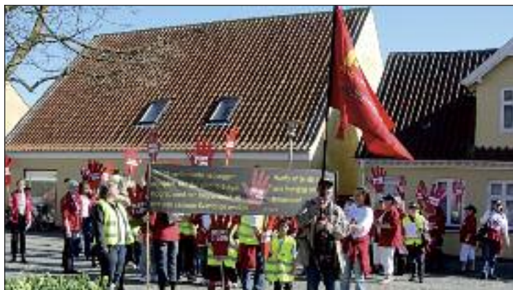
FOAs fane kom i arbejde straks efter indvielsen. Her er vi i Skagen.

Lørdag – ingen registrering Skagen kl. 10-13. Hoppepude for børnene og uddeling af flyers og postkort. Det foregik på Viggo Hansens Plads.