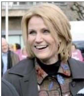
Socialdemokratiets formand Helle Thorning-Schmidt er træt af Lars Løkkes lappeløsninger.

Lars Løkke Rasmussen har gennem sine seks år som sundhedsminister ikke villet tage livtag med de grundlæggende problemer i sundhedsvæsenet. Helt konkret betyder Løkkes lappeløsninger fx, at kræftbehandlingen i Danmark er langt dårligere og langsommere end