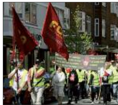
FOA Frederikshavns nye fane har ikke hængt til pynt. Den er der, hvor faner skal være. Her til demonstration i Aalborg, hvor FOA besøgte Regionshuset for at markere sammenbruddet på overenskomstforhandlingerne.