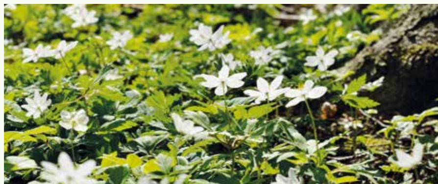
Foråret er på vej, og snart er det 1. maj, som vi traditionen tro fejrer i FOA 1.

Foråret er lige om hjørnet, og snart er det 1. maj. Traditionen tro markerer vi dagen med morgenbord i kælderen, samvær, sange og taler. Kom og vær med!