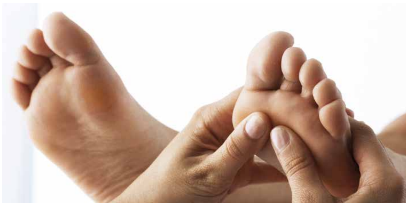
Nu kan du også få tilskud til fodterapi gennem FOA 1 og Bistandsfonden.