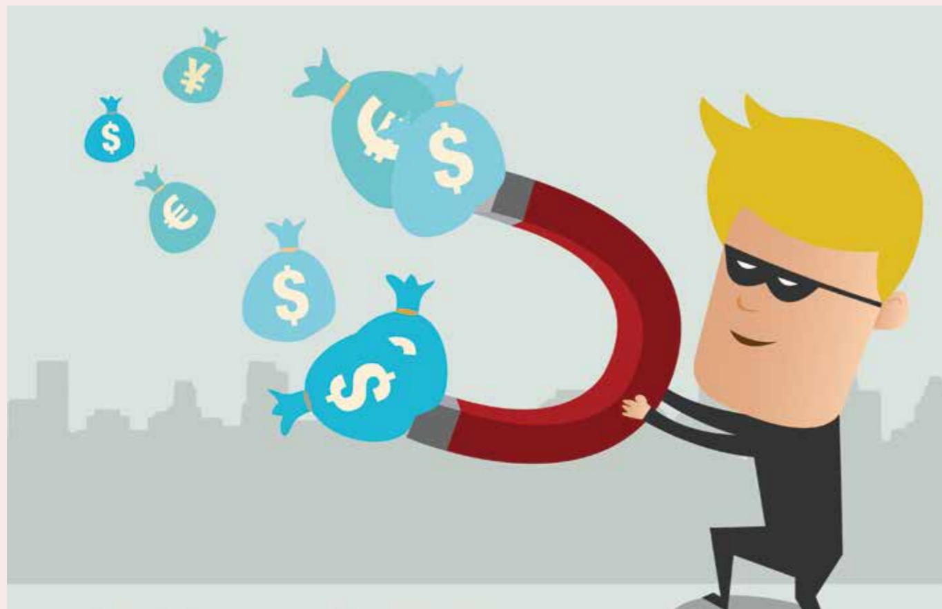
Omprioriteringsbidraget er tyveri ved højlys dag. Regeringen tager penge fra Kommune- og Regionskasserne og putter i egen lomme, for at have råd til at bruge penge, som de har lyst til