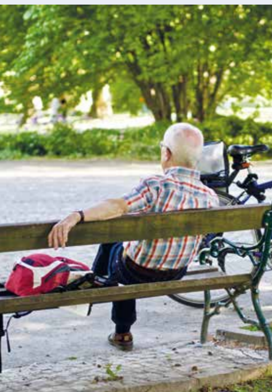
Det er sundt og sjovt med et aktivt seniorliv. FOA 1s seniorklubber byder på et væld af aktiviteter og en masse nye bekendtskaber.