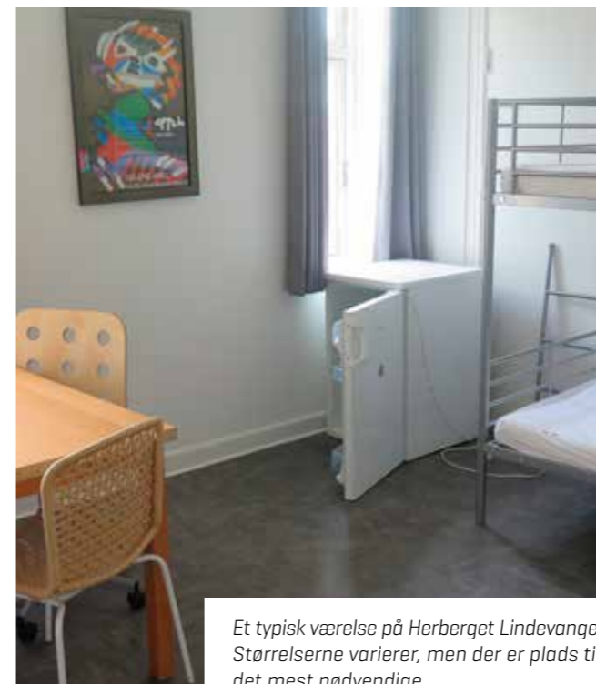
Et typisk værelse på Herberget Lindevangen. Størrelserne varierer, men der er plads til det mest nødvendige.