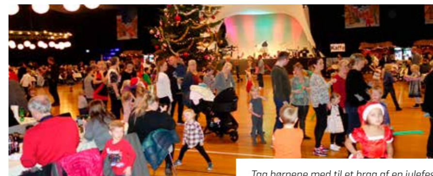
Tag børnene med til et brag af en julefest!