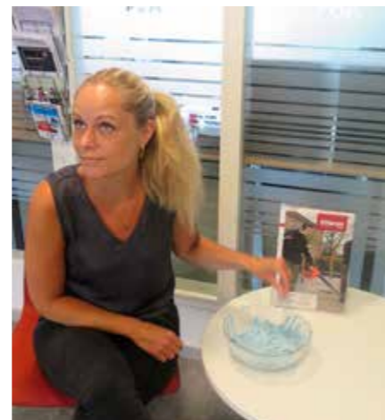
Der blev trukket lod blandt de 259 deltagere.

Så er du med i konkurrencen om en iPad. Vinderen bliver kontaktet direkte. ■