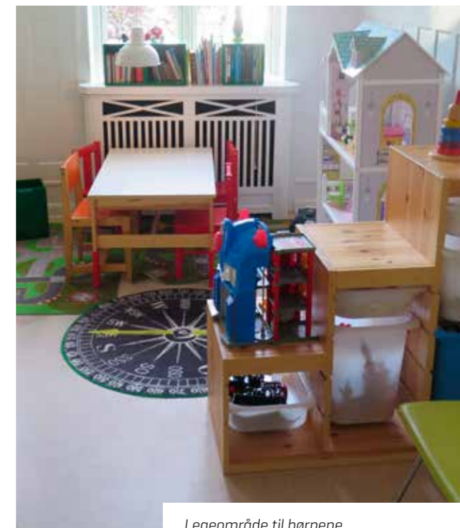
Legeområde til børnene