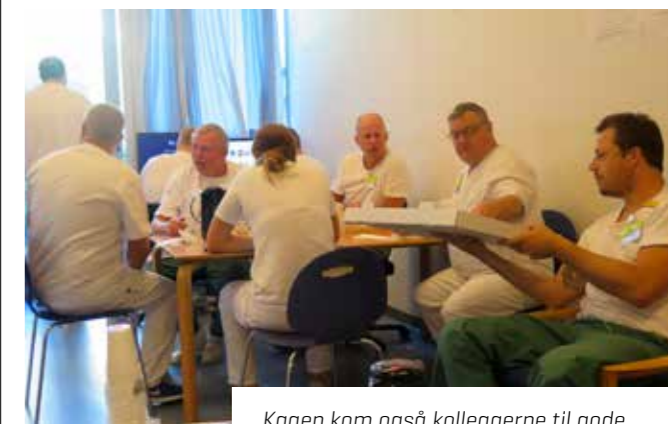
Kagen kom også kollegaerne til gode.

Hovedbestyrelsen vil nemlig gerne udforme et målprogram, der bygger bro mellem det, som optager medlemmerne og det, som FOA arbejder med på et overordnet niveau. ■