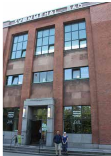
Indgangen til Frederiksberg Svømmehal.

”Da markedet for privat svømmehalsdrift er ganske begrænset i Danmark, har Kultur og Fritid i samarbejde med Udbud og Indkøb gennemført en markedsdialog ... Markedsdialogen er gennemført i februar måned, og da tre private aktører her har tilkendegivet interesse for at overtage svømmehallen.....”.