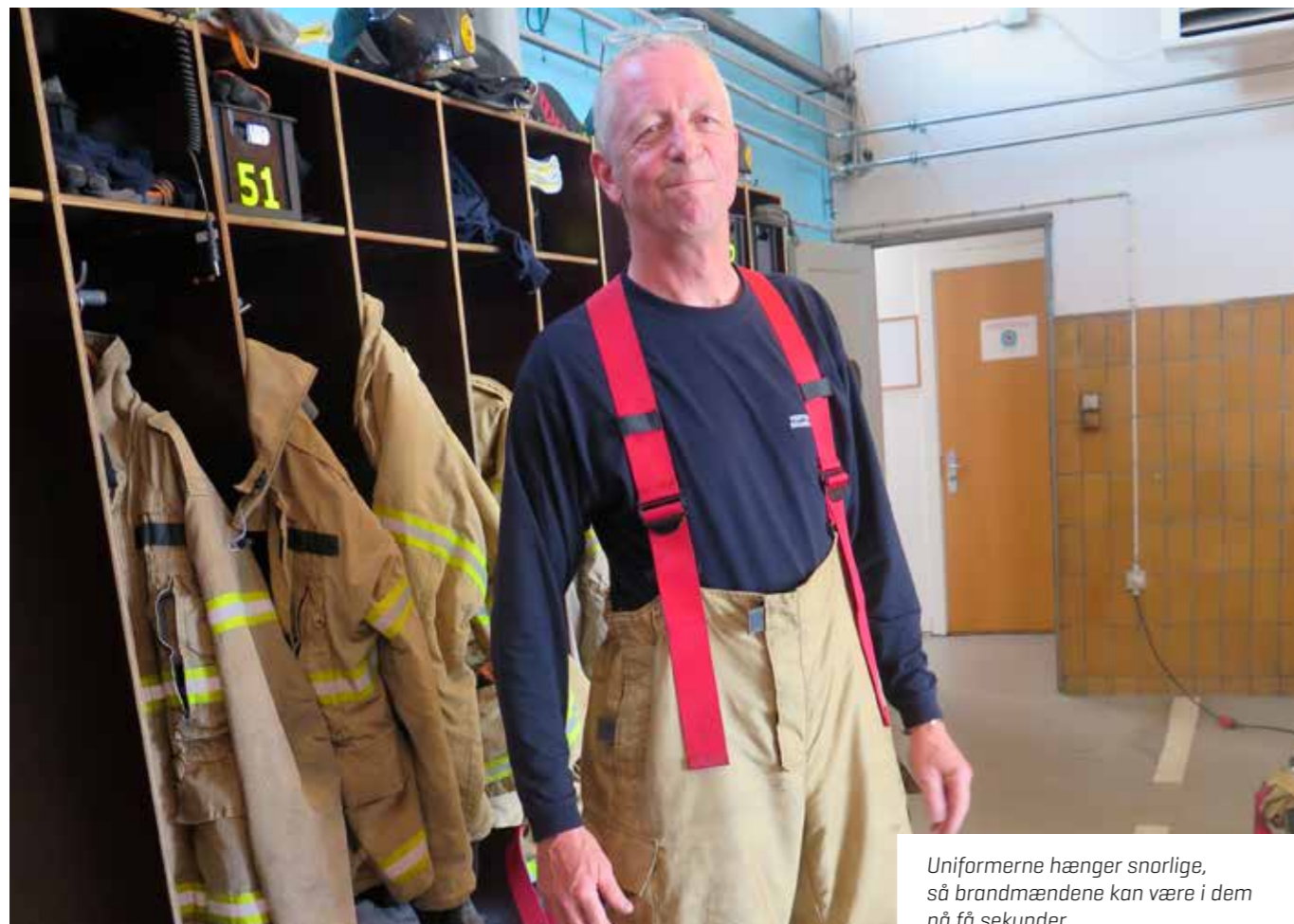
Uniformerne hænger snorlige, så brandmændene kan være i dem på få sekunder.