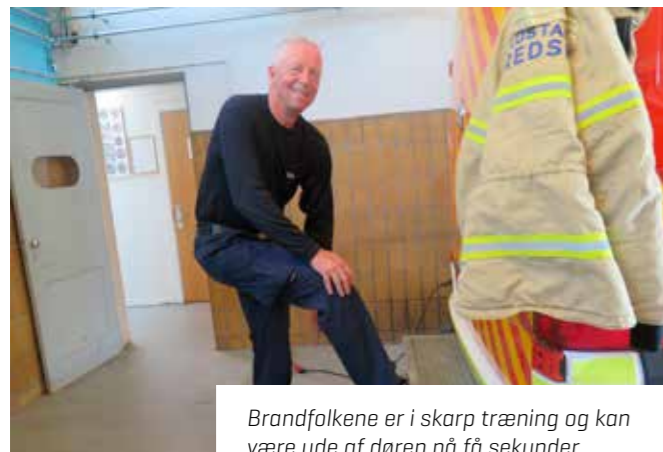
Brandfolkene er i skarp træning og kan være ude af døren på få sekunder.