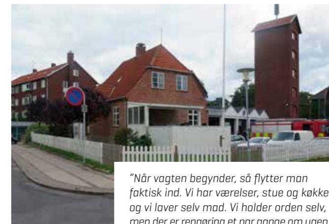
”Når vagten begynder, så flytter man faktisk ind. Vi har værelser, stue og køkken, og vi laver selv mad. Vi holder orden selv, men der er rengøring et par gange om ugen.”

”Samtidig har den teknologiske udvikling betydet, at vi kan løse opgaver bedre end tidligere, fx ved kemikalieudslip. Her holder vi øvelser i kemikaliedragter, og vi kan være i direkte kontakt med Beredskabsstyrelsens Kemikalievagt, men vi henter også meget hjælp i bøger og på iPad’en.”