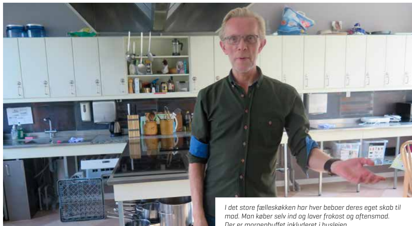
I det store fælleskøkken har hver beboer deres eget skab til mad. Man køber selv ind og laver frokost og aftensmad. Der er morgenbuffet inkluderet i huslejen.