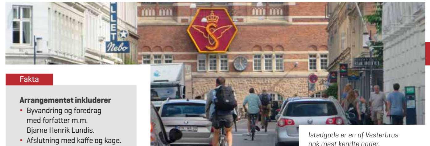
Istedgade er en af Vesterbros nok mest kendte gader.

Tilbud: Mens man er indskrevet på herberget, bliver der udviklet en opholdsplan i samarbejde med personalet. Planen har til formål at klarlægge, hvad der samarbejdes om under opholdet. Ligeledes bliver der løbende holdt løsningsorienterede samtaler, hvor der bliver sat fokus på beboernes fremtidsmuligheder.