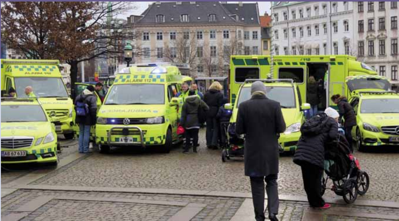
Beredskaberne oplever i stigende grad konsekvenserne af en udlicitering.

Da Falck lige såvel som de kommunale beredskaber kender de reelle priser på at drive et beredskab, så er det nemt at komme med et lavere bud i de områder, hvor der er en kommune, der også byder. Samtidig kan Falck hæve prisen tilsvarende i de områder, der ikke er nogen reel konkurrence i.