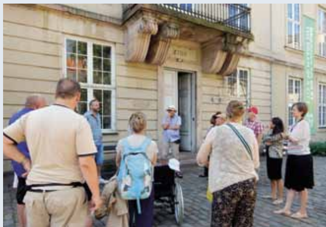
Billedet er fra FOA 1's sommerfest 2015 som startede med en byvandring.

De to billeder er identiske bortset fra, at der på det ene har sneget sig 5 fejl ind.