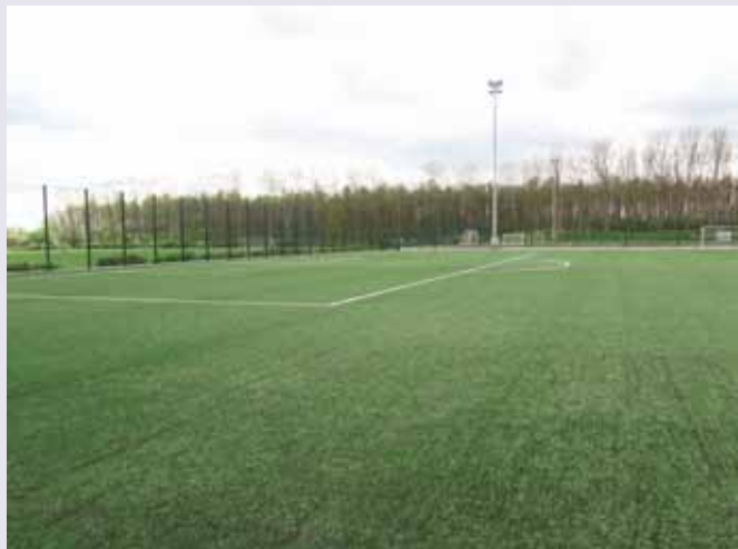
Målfeltet på en af kunststofbanerne.