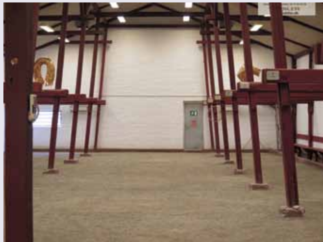
Stalden, hvor der spilles indendørs petanque.