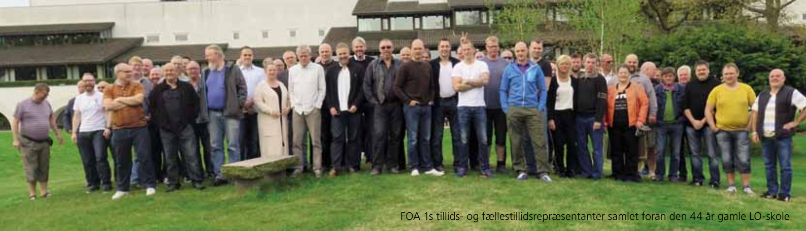
FOA 1s tillids- og fællestillidsrepræsentanter samlet foran den 44 år gamle LO-skole