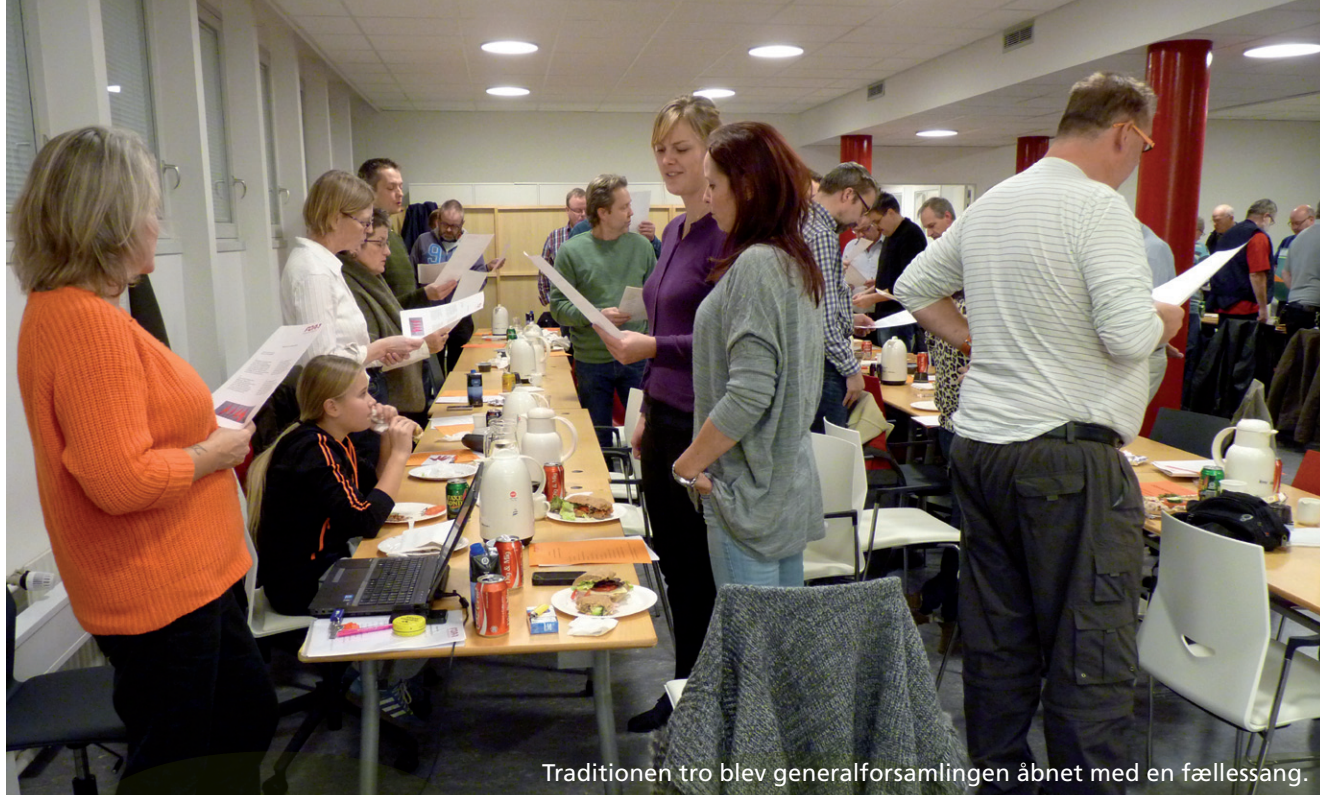
Traditionen tro blev generalforsamlingen åbnet med en fællessang.