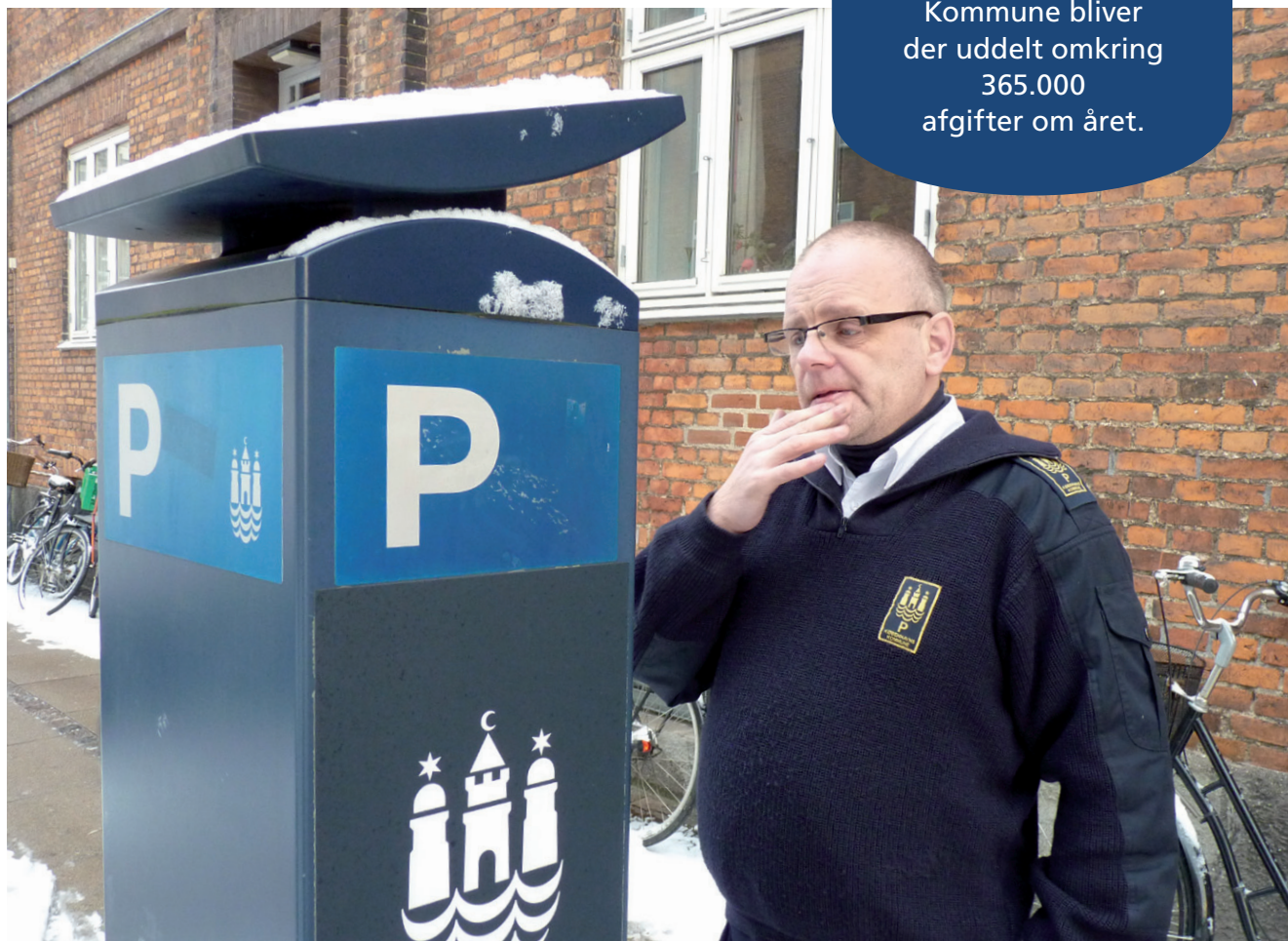
Selv en p-vagt tjekker reglerne, når bilen skal parkeres i et nyt område.

I Københavns Kommune bliver der uddelt omkring 365.000 afgifter om året.