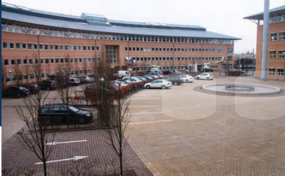
Den tidligere amtsgård ved Glostrup Station.

”domstols-butik”, hvor man kan få ordnet notar-dokumenter etc. Så der er i sagens natur en del aktivitet i bygningerne.