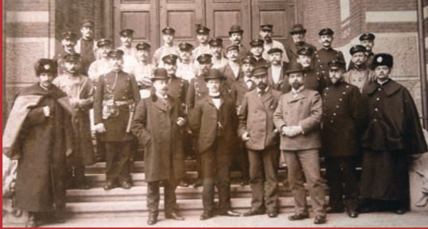
Man må gå ud fra, at disse herrer allerede har været til jubilærfest!.