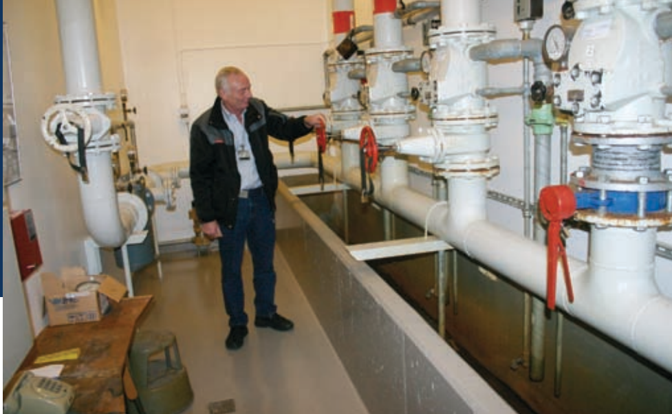
Fra dette rum styres bygningernes sprinkler-anlæg, der skal afprøves jævnligt.