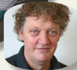
- af Ole Bruun, FOA 1

Som medlem kommer du ikke til at mærke meget til omstruktureringen i a-kassen.