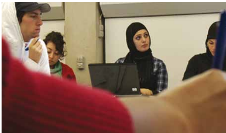
Kvinder i Forandring - en film om indvandrerkvinder og uddannelse. Spillelængde: 41 min. Instruktion: Barbara Cros og Lisbeth Lyngse Fotograf: Henrik Kloch og Lisbeth Lyngse Manden Med Cameraet 2009

Ønsker man at låne filmen, kan man henvende sig til Marian Holst Petersen i FOA Århus på aarhus@foa.dk