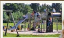
Kæmpe legeplads og stort aktivitetscenter

OPLEV FODRING AF ROVDYRENE OG VILDE DYREHISTORIER!