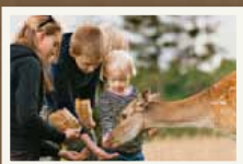
Kom helt tæt på Bambi!