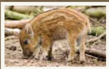
Masser af søde dyrebørn!