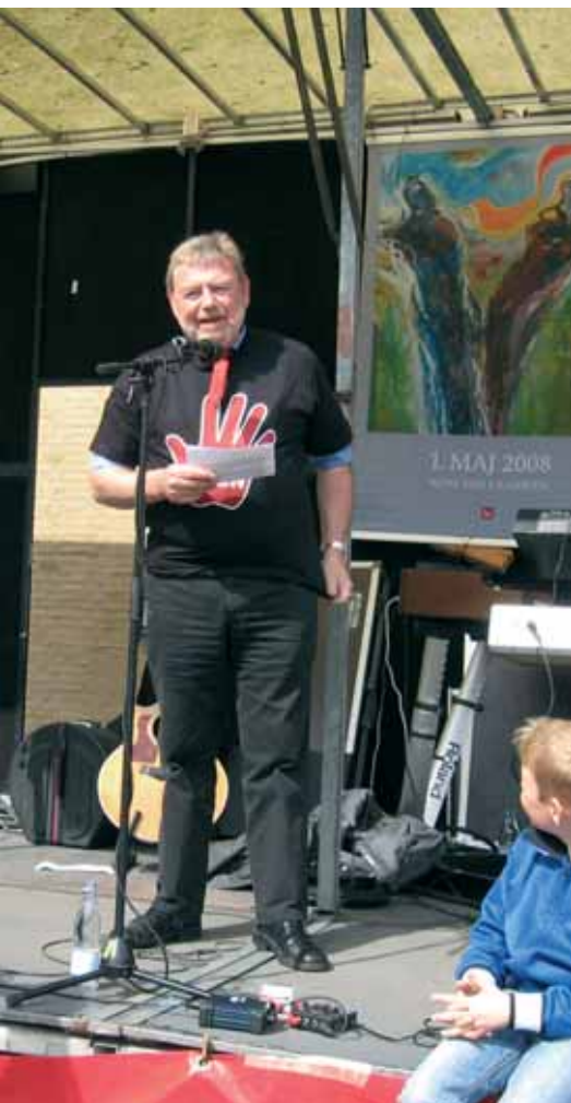
1. maj i Det Bruunske Pakhus. Socialudvalgsformanden viste sin sympati ved at trække i en FOA trøje

tivisere eller sætte på samlebånd. Ingen tvivl om, at vi alle ønsker den bedste velfærd for skatteydernes penge, men det får man altså kun, hvis man sætter de ansatte fri, så de har mulighed at anvende deres faglighed, viden og erfaring.