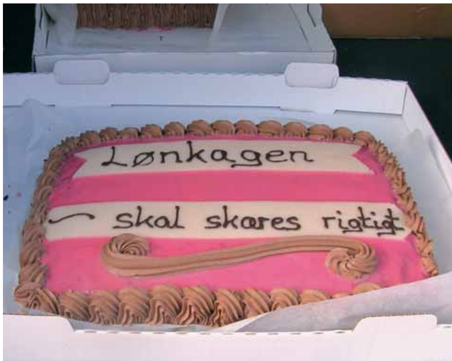
Kagen var stor, men der var delte meninger om hvor meget FOA skulle have!

Tillidsrepræsentanterne er indkaldt til såkaldte TR udviklings samtaler i afdelingen. Det er meningen, at man på disse samtaler, skal drøfte den enkelte Tillidsrepræsentants kompetence, uddelegering, aflønning og vilkår for hvervet. Dette skulle meget gerne resultere i, at du som medlem i meget højere grad kommer til at opleve, at FOA er på arbejdspladsen.