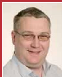
Jan Vestentofts del