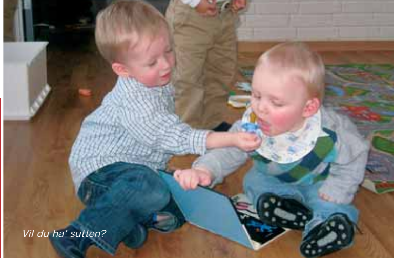
Vil du ha' sutten?