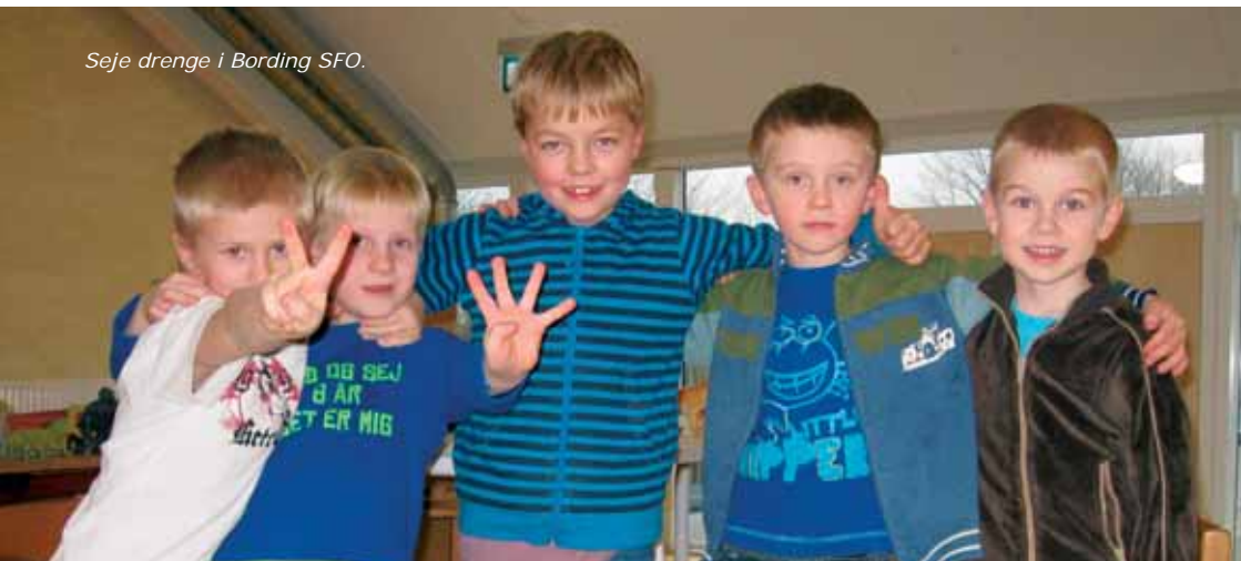
Seje drenge i Bording SFO.

”Det er vigtigt at stille krav om medindflydelse og sidde med ved bordet, hvor