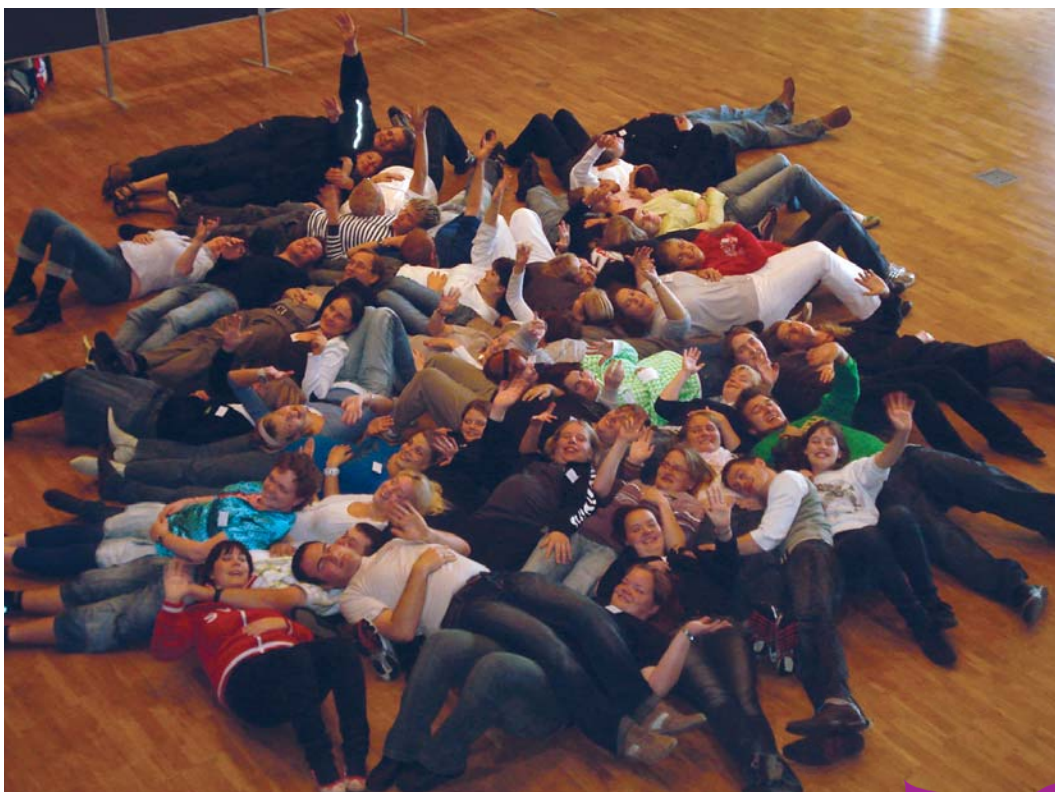
Landsmøde i FOA Ungdom

Ens rettigheder for homoseksuelle og heteroseksuelle par under barsel "Jeg vil ikke diskrimi- neres på grund af min seksualitet."